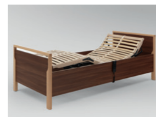
Einzelbett „Relax“ mit Motorrahmen, Rücken- und Beinlehne elektro- motorisch verstellbar