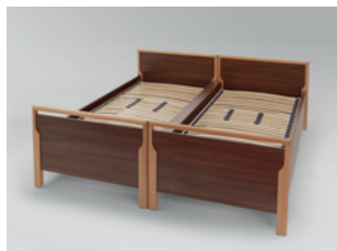
Holz-Abdeckung (Buche Dekor) zur Verkleidung des Mittelspaltes bei Nutzung als Doppelbett