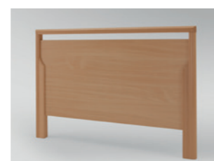
Holzrahmen Buche massiv, Füllungen und Bettseiten in Buche Dekor