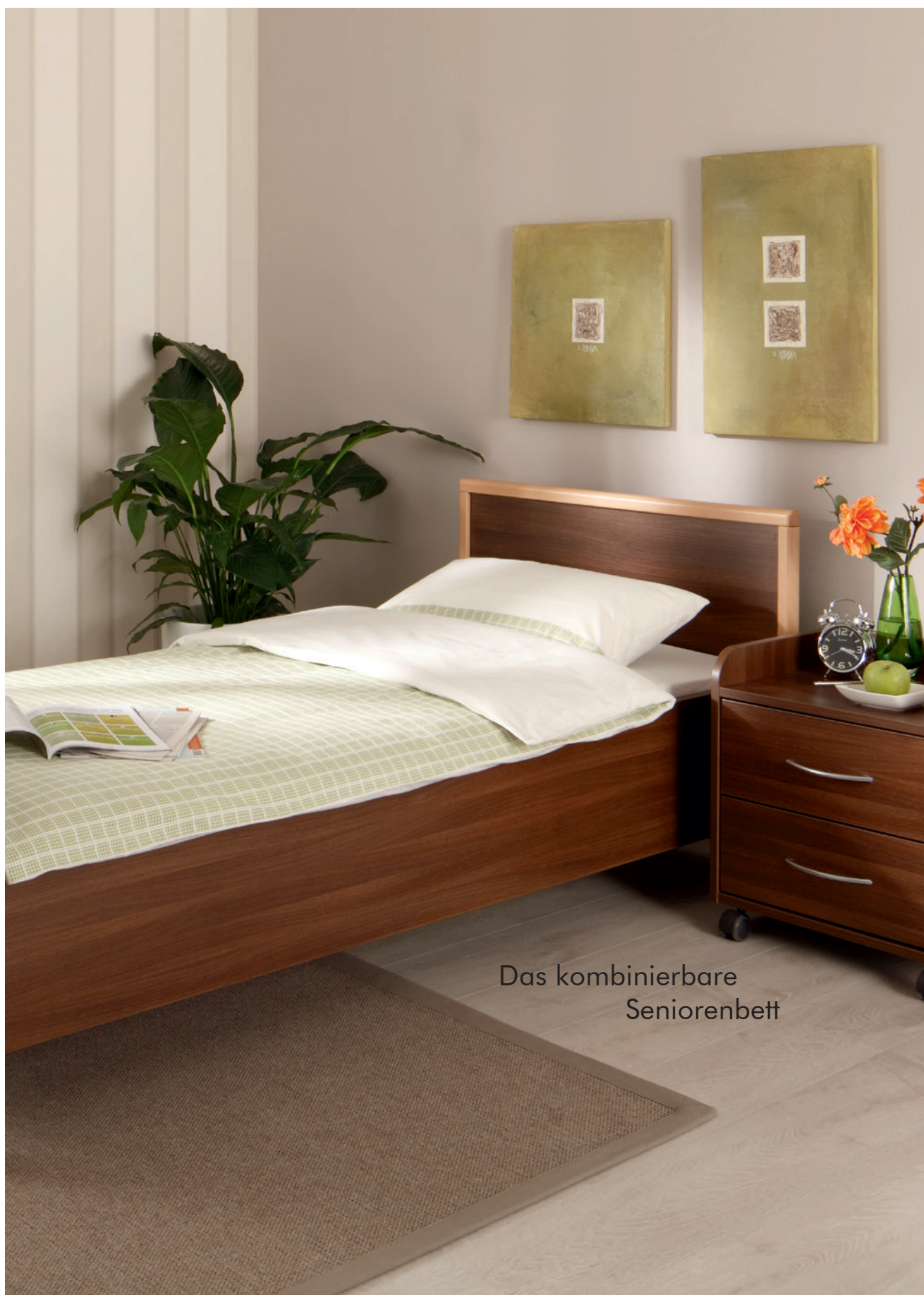
Das kombinierbare Seniorenbett