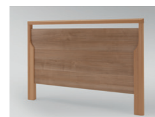
Holzrahmen Buche massiv, Füllungen und Bettseiten in Havanna Dekor