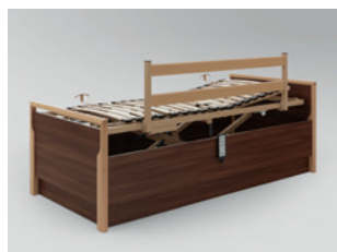
Seitensicherung aufsteckbar in Kombination mit Lippe IV