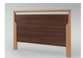
Holzrahmen Buche massiv, Füllungen und Bettseiten in Bella Noce Dekor