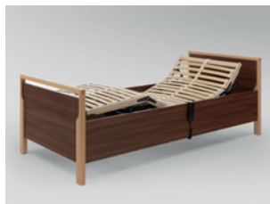
Motorrahmen, Rücken- und Beinlehne elektromotorisch verstellbar (90 x 200 cm und 100 x 200 cm)