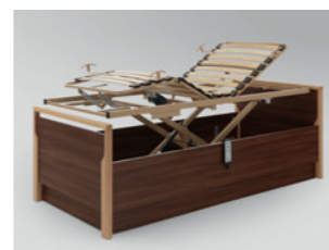
Einzelbett „Relax“ mit höhenverstellbarem Bettein- satz „Lippe“ und bodentie- fen Bettseiten, Rücken- und Beinlehne sowie Liegehöhe elektromotorisch verstellbar