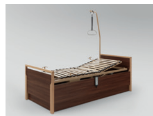
Aufrichter mit Triangelgriff in Kombination mit Lippe IV