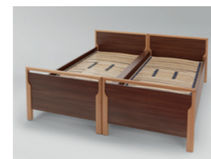
2 Einzelbetten als Doppelbett zusammengestellt, Mittelspalt durch Holzabdeckung verkleidet