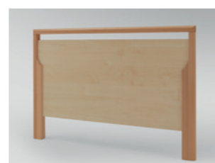
Holzrahmen Buche massiv, Füllungen und Bettseiten in Ahorn Dekor