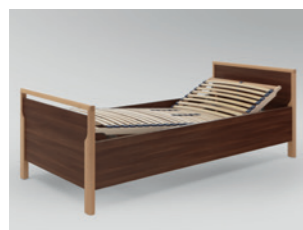
Einzelbett „Relax“ mit Lattenrost, Rücken- und Beinlehne manuell verstellbar