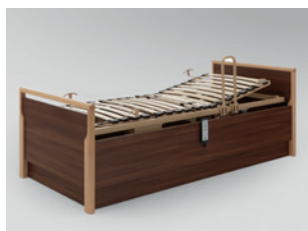
Aufstehhilfe in Kombination mit Lippe IV (Lippe 120 Abb. ähnlich)