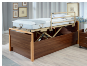
adaptierbare Seitensicherung in Kombination mit Lippe IV