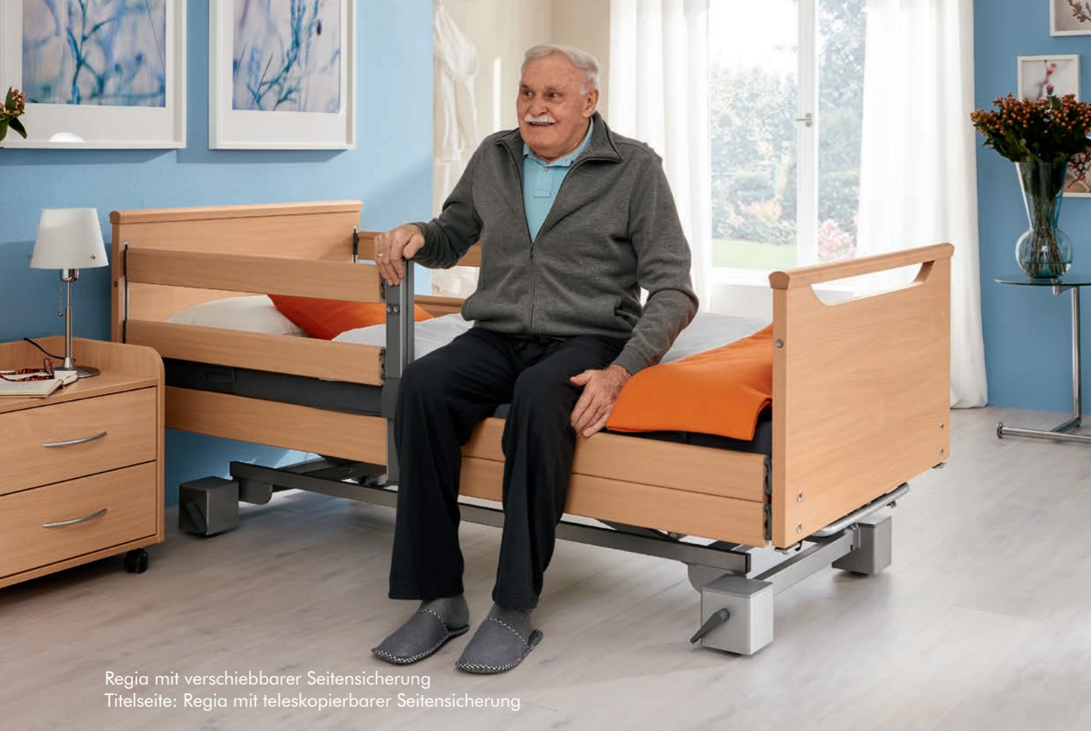
Regia mit verschiebbarer Seitensicherung Titelseite: Regia mit teleskopierbarer Seitensicherung