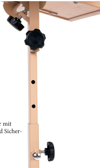
Rahmenrohr mit Handrad und Sicherungsstift

Wichtig: Achten Sie darauf, dass der Sicherungsstift hörbar einrastet und ziehen Sie erst danach das Handrad wieder fest.