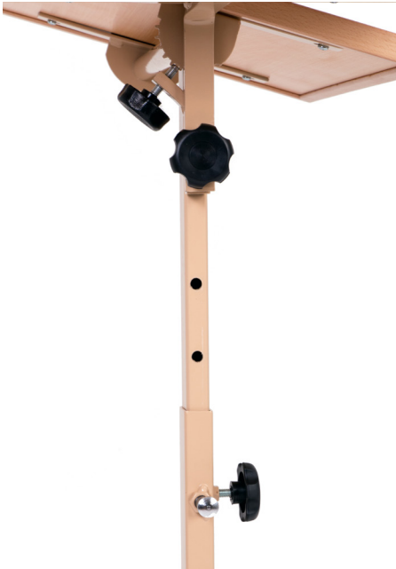
Crossbar with hand wheel and locking pin.

Important: Make sure that the locking pin snaps in before you tighten the hand wheel again.