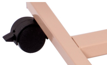
Frein de stationnement

Attention: Assurez simplement la „REHASHOP table de lit Robeti“ contre des déplacements non souhaités en bloquant les freins. Un sol lisse ou irrégulier augmente le risque de déplacement de la table.