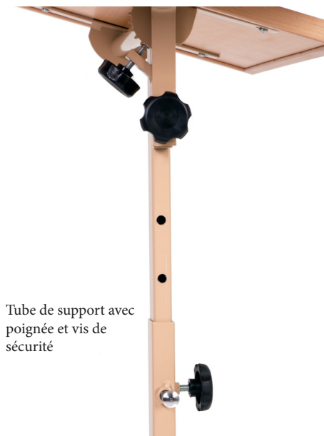
Tube de support avec poignée et vis de sécurité

Attention: assurez-vous que la vis de sécurité soit bien arrêtée dans sa position avant de reserrer la poignée.