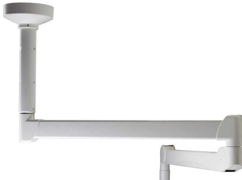
Abbildung zeigt: Deckenbefestigung komplett mit Deckenarm AC2000

Eine Montage des Deckenarms ohne zugehörige Deckenbefestigung ist nicht möglich.